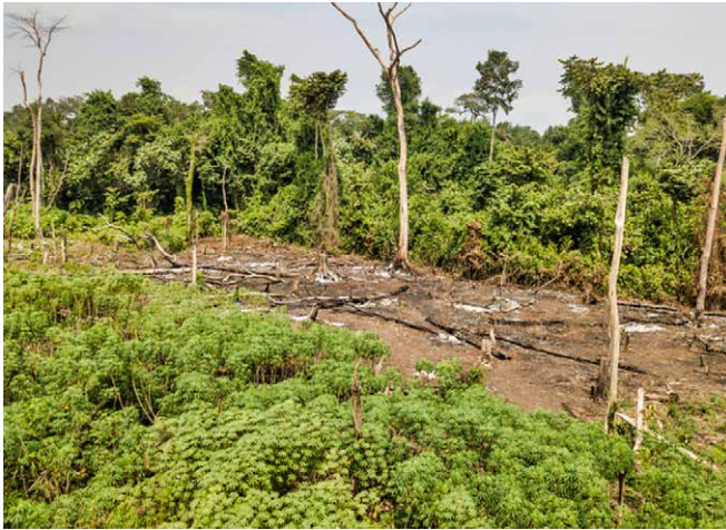
Fig. 2 : Agriculture de subsistance itinérante sur brulis.

L'étude de marché effectuée sur les produits dérivés de ces cultures révèle que la production locale ne satisfait pas totalement la demande. Environ 26% des denrées sont fournies par d'autres provinces ou sont importées.